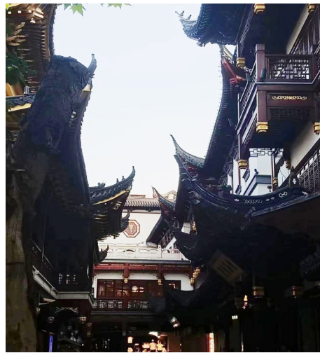
□ 2021级机电1班 李周晨 指导教师:吴金群