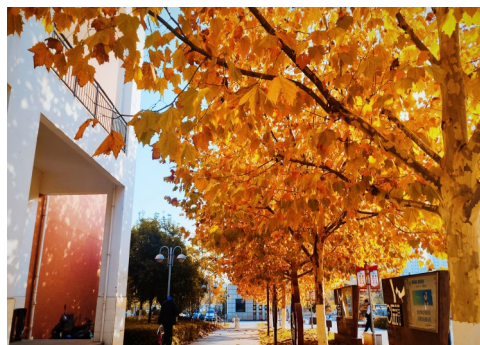
□ 22级计算机1班 潘世岗 指导教师:黄成园